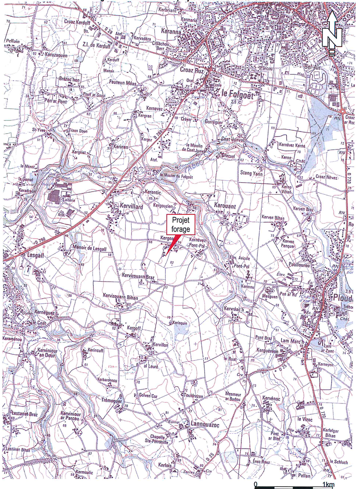
Figure 1 – Localisation du projet sur fond de carte IGN